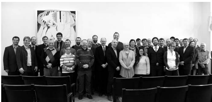
Účastníci Oblastní konference 2016